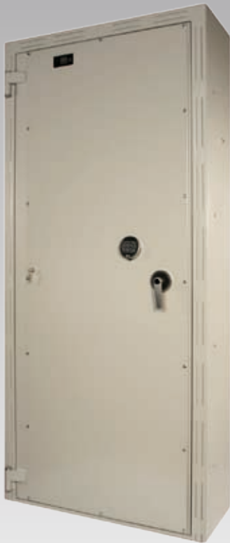
Abb.: AVi2-20, Blockzarge (mit Sonderausstattung EZ LG Basic mit Notöffnungsmöglichkeit von innen)

Diese Tür können Sie von außen auch mit einer normalen Zimmertür verkleiden und damit tarnen.