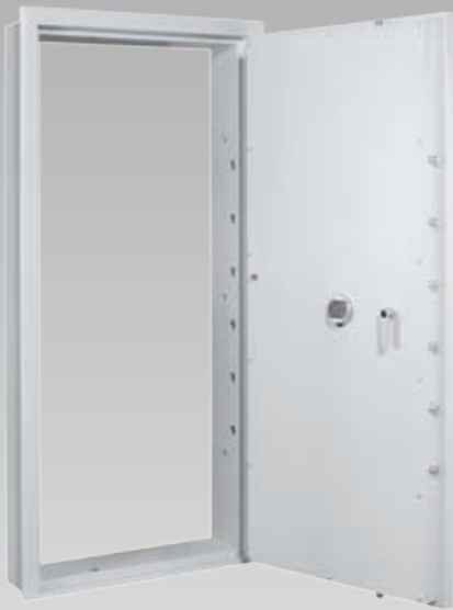
Abb.: AT2-20, Eckzarge (mit Sonderausstattung EZ LG Basic als Notöffnungsmöglichkeit von innen)