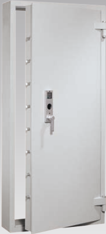
Abb.: AVB 20, Blockzarge (mit Sonderausstattung EZ Code Combi B)