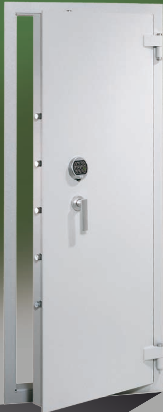
Abb.: AVB 22