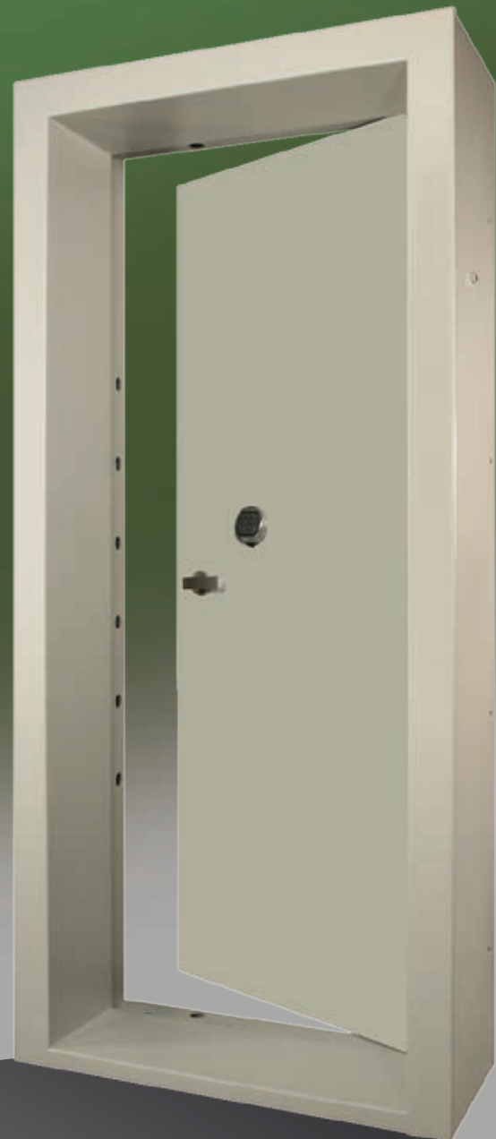
Abb.: ATi 2-20