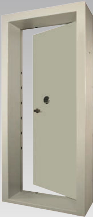
Abb.: ATi 2-20, Blockzarge

Diese Tür können Sie von außen auch mit einer normalen Zimmertür verkleiden und damit tarnen.